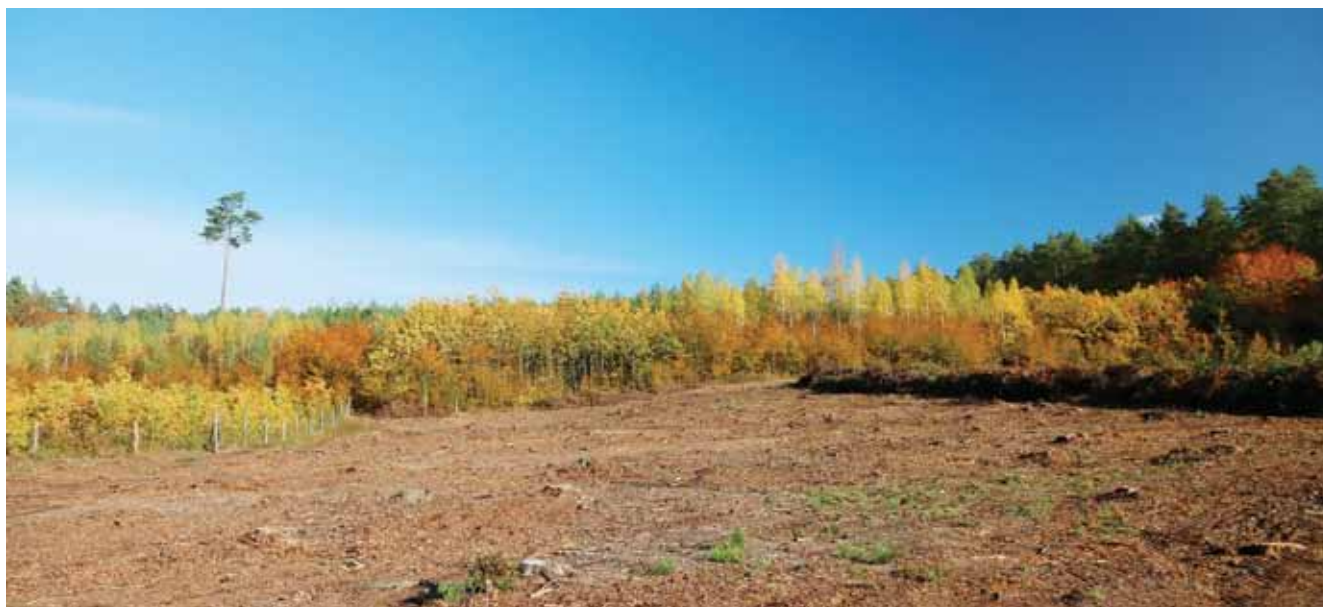
Fragment powierzchni po rębni złożonej. Z lewej strony widoczne „gniazdo” z posadzonym wcześniej dębem, ogrodzone przed zwierzyną płową (sarny, jelenie), w głębi starsze „gniazdo” dębowe oraz fragmenty naturalnego odnowienia bukowego. Niedługo spalane, obecnie złożone i pozostawione do naturalnego rozpadu gałęzie poeksploatacyjne. Wkrótce powierzchnia ta zostanie odnowiona odpowiednimi gatunkami lasotwórczymi

Wyróżniamy tu pod względem wielkości powierzchni manipulacyjnej dwie formy: rębnią gniazdową zupełną (IIIa) o powierzchni manipulacyjnej szerokości 80 – 100 m lub na powierzchni do 6 ha. Stosuje się ją najczęściej w drzewostanach o uproszczonym składzie gatunkowym w celu ich przebudowy