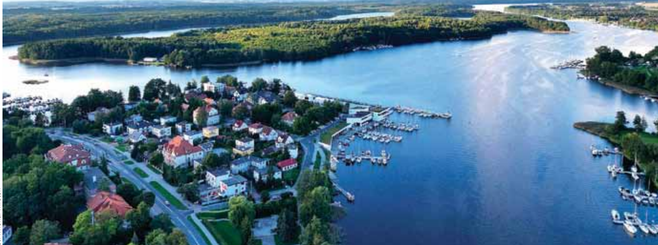
Południowy kraniec Jezioraka. Widok na infrastrukturę Portu Śródlądowego w Iławie z lotu ptaka. Na drugim planie wyspa Wielka Żuława

Nowy zastrzyk gotówki – prawie 2 miliony złotych – pochodzi z programu regionalnego „Fundusze Europejskie dla Warmii i Mazur 2021–2027”. Środki te zostały pozyskane przez samorząd powiatu w ramach strategicznego projektu „Szlak Kulturowy Kanału Elbląskiego”, realizowanego przez Związek Gmin i Powiatów Kanału Elbląskiego i Pojezierza Iławskiego. Na co dokładnie zostaną przeznaczone pieniądze? Zmiany odczujemy zarówno w sferze infrastruktury, jak i edukacji.