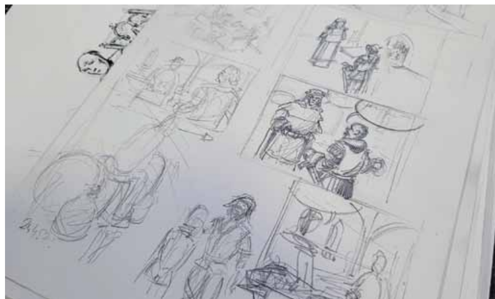
Szkiele do komiksu o Koperniku

czyliśmy więc na pracę. Pół roku pochłonęło samo rysowanie. To była wspaniała praca, ale miewałem kryzysy. Komiks powstawał w ramach projektu, więc goniły mnie terminy. To była dodatkowa mobilizacja. Gdybym nie miał takiego motywatora, pewnie bym odłożył komiks na półkę. Na przykład latem mieliśmy straszne upały. Praca posuwała się wolno, ale zegar cały czas tykał. Musiałem więc działać. Tylko jak, skoro było gorąco, a ręka przyklejała się do kartki? Nie mogłem nawet się oprzeć, nie mówiąc o przesuwaniu ręki, które jest konieczne przy posługiwaniu się ołówkiem i tuszem. Usilnie