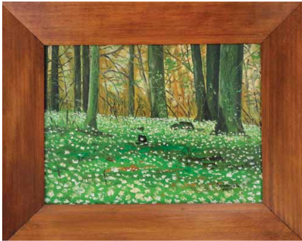
Z cyklu Leśne pory roku, olej na płótnie w wykonaniu autora

Powróćmy jednak do tytułowych rozważań o wycinaniu lasu. Chociaż sam w swojej 45 - letniej służbie w Lasach Państwowych, zajmując różne stanowiska w hierarchii zawodowej przyczyniłem się do wycięcia tysięcy leśnych drzew, jednak pozostając w tej samej konwencji, tyśiąckrotnie ich więcej posadziłem. Staram się jednak zrozumieć niechęć części społeczeństwa do wycinania lasów. Nie dość, że nie dziwią mnie emocje związane z wycinką drzew, to jeszcze wręcz cieszy mnie troska o nasze wspólne dobro, jakim są lasy. Nie tak dawno, gdy obok ronda na obrzeżach Iławy (jadąc od strony Susza) wycięto fragment drzewostanu, dyskusja o celowości tych poczynań iławskich leśników odbiła się echem w miejscowej prasie. Jedna z redakcji udostępniła mi wpis na swoim forum czytelnika podpisującego się „miłośnik lasu”. Z tonu wpisu wyłania się troska o stan naszych lasów i jest to zrozumiałe i godne szacunku, ale jednocześnie, co się nader często zdarza,