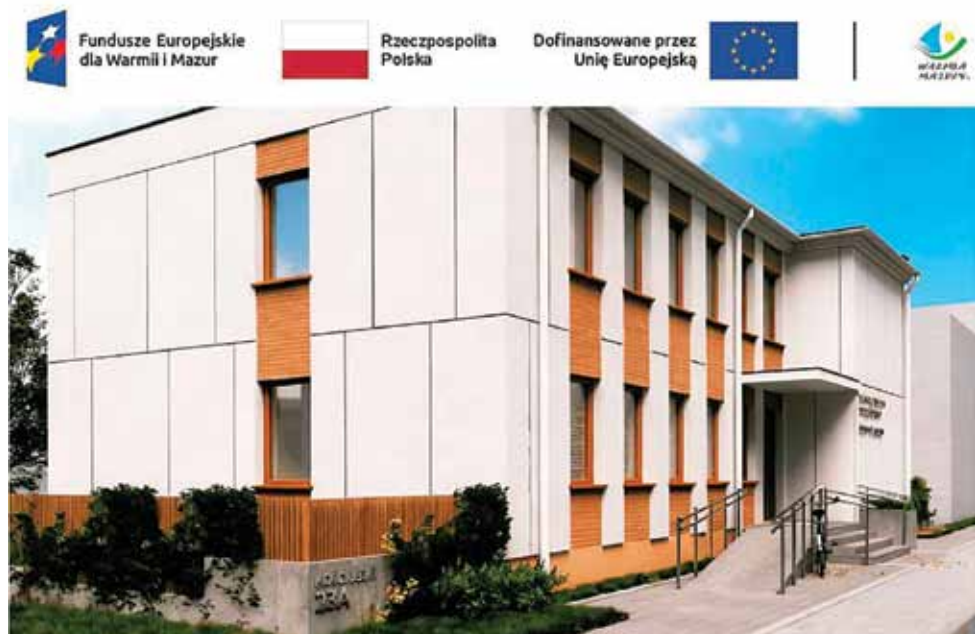
W ramach pierwszego etapu inwestycji zostanie zagospodarowana bryła zachodnia obiektu. Warto dodać, że w budynku będzie również funkcjonować prowadzony przez Sąd Rejonowy w Iławie Ośrodek Kuratorski.

3 060 541,04 zł Wydatki kwalifikowalne: 3 049 631,04 zł Dofinansowanie: 2 683 370,35 zł w tym finansowanie UE: 2 549 201,83 zł, budżet państwa: 134 168,52 zł) Wkład własny Powiatu: 377 170,69 zł