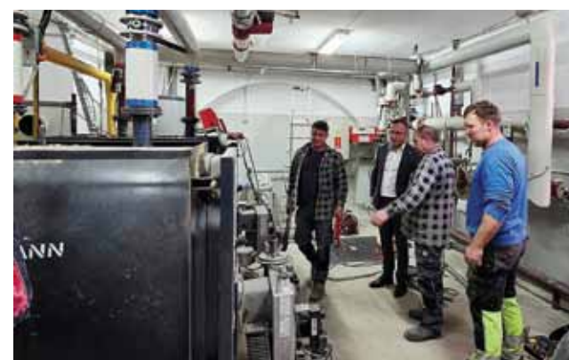
gazu, co przełoży się na oszczędności w eksploatacji budynku. Koszt inwestycji to 320.000,00 zł, a wykonawcą prac jest firma Przedsiębiorstwo Usługowo-Handlowe Maciej Kasperkiewicz z Brodnicy.

Dzięki modernizacji placówka będzie w pełni przygotowana na chłodniejsze miesiące – nowe, nowoczesne kotły zapewnią niezawodne i bezpieczne ogrzewanie, a dodatkowo przyczynią się do zmniejszenia zużycia