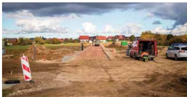
NOR z Susza. Środki na realizację prac pochodzą z Rządowego Funduszu „Polski Ład”.

Wykonawcą inwestycji wyłonionym w drodze przetargu jest firma TE-