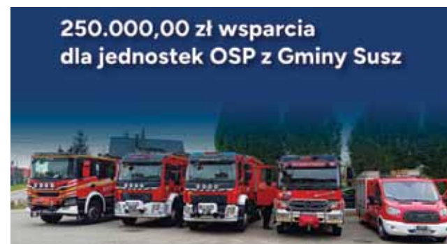
Susz zapewniła wymagany wkład własny. Dzięki tym środkom wremiazach strażackich zostaną zamontowane pompy ciepła i instalacje fotowoltaiczne, a także wymienione bramy wjazdowe, co przyczyni się do poprawy komfortu pracy strażaków oraz zwiększenia efektywności energetycznej budynków. Kolejne wsparcie pochodzi z programu Fundacji

Każda jednostka otrzymała dotację w wysokości 30 000,00 zł, a Gmina