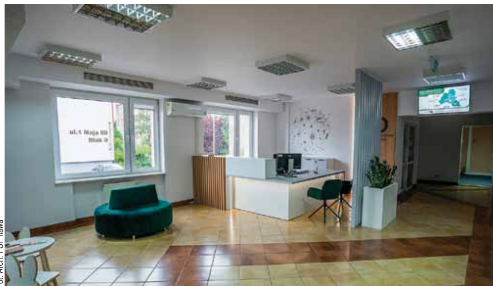
Punkt doradztwa dla młodzieży znajduje się w Powiatowym Urzędzie Pracy w Iławie. To „jedno okienko” z kompleksową informacją i wsparciem dla osób do 30 roku życia.

Do tego wśród młodych ludzi niestety nie należy do rzadkości niska samoocena, pokutuje też niewielka samoświadomość: wówczas ktoś może nie do końca zdawać sobie sprawę ze swoich mocnych i słabszych stron oraz mieć trudności w nakreśleniu celów. Wreszcie - i to akurat może zaskoczyć - kompetencje IT wśród tej grupy wie-