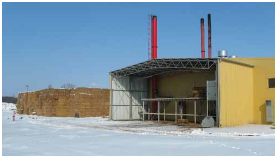
Spalarnia słomy. Daje ciepło prawie całemu miastu Kisielice i radykalnie zmniejsza emisję gazów cieplarnianych