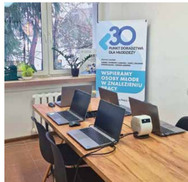
Sala w Inkubatorze Technologicznym w Iławie, w której odbywają się darmowe warsztaty z kompetencji cyfrowych

Możliwość zwrotu kosztów dojazdu w sytuacji, gdy prak-