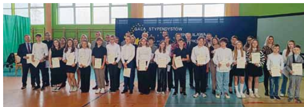
Zespół Szkolno - Przedszkolny w Wikielcu