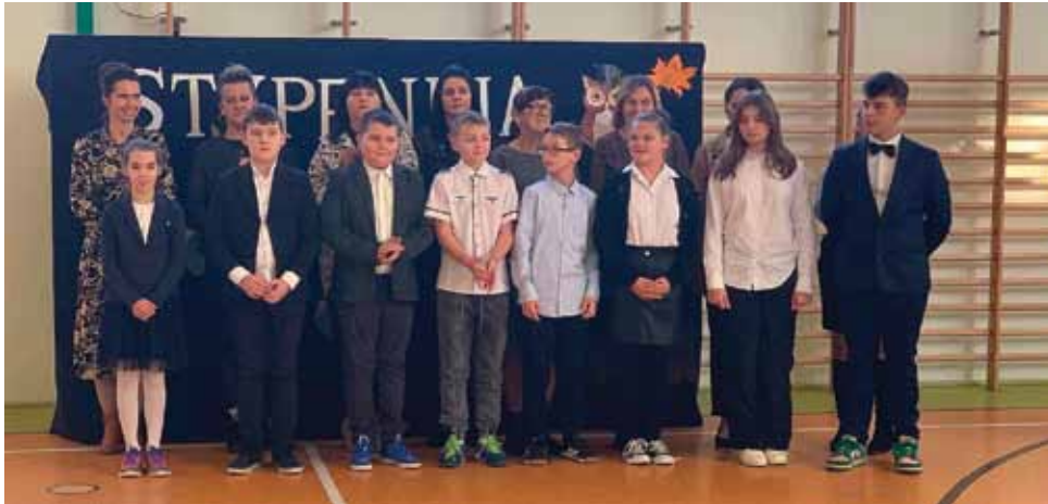
Szkoła Podstawowa w Gromotach