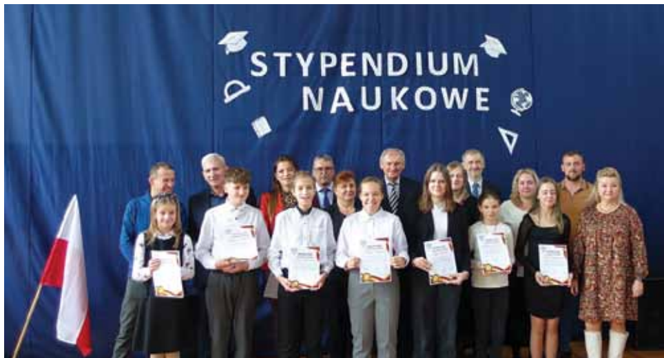
Szkoła Podstawowa im. mjr Henryka Dobrzańskiego „HUBALA” w Gałdowie