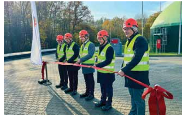
Symboliczne przecięcie wstęgi