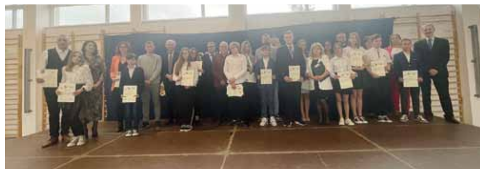
Szkoła Podstawowa im. Marii Konopnickiej w Lasecznie