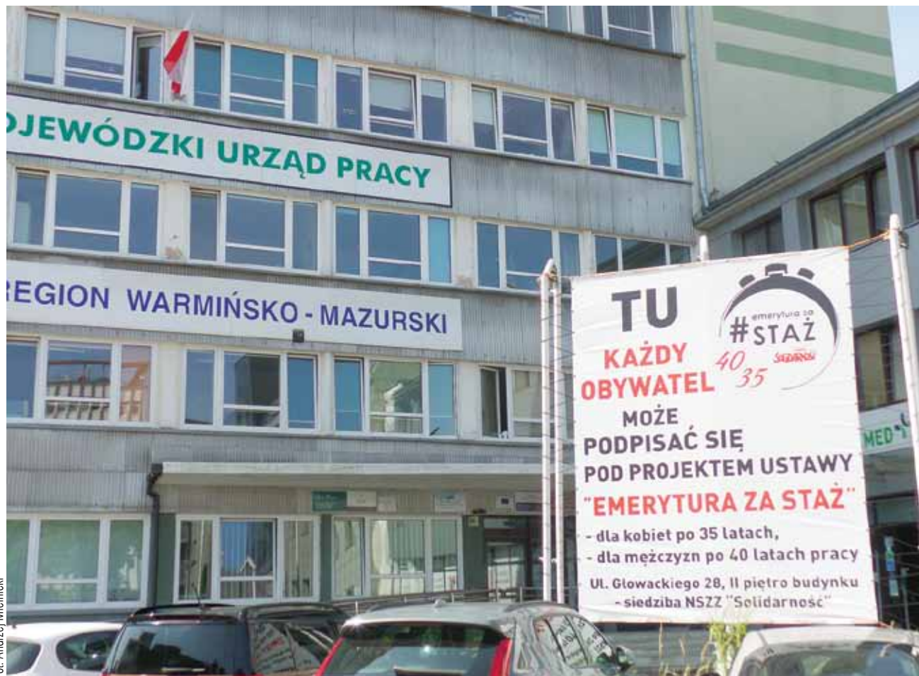
Pod obywatelskim projektem ustawy „Emerytura za staż” podpisało się 235 tys. osób

OPZZ od lat zabiega o emerytury stażowe. Pierwszy