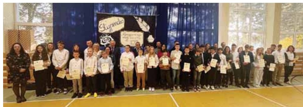
Szkoła Podstawowa im. Michała Lengowskiego w Rudzianicach

doceniło ekologiczne inicjatywy i dbałość o estetykę wsi. Podczas gali w Olsztynie mieszkańcy odebrali nagrodę, podkreślając wartość wspólnej pracy. Wyróżnienie to inspirowało do dalszych działań na rzecz środowiska i piękna wsi, pokazując, że zaangażowanie społeczności przynosi wymierne efekty i może być przykładem dla innych.