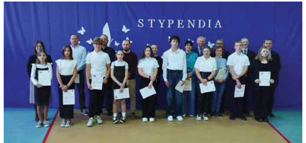
Szkoła Podstawowa we Franciszkowie