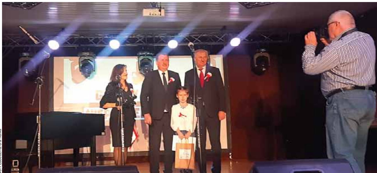
GOK Laseczno/GS Iława