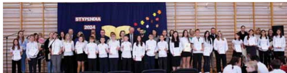
Szkoła Podstawowa im. Twórców Literatury Dziecięcej w Ząbrowie