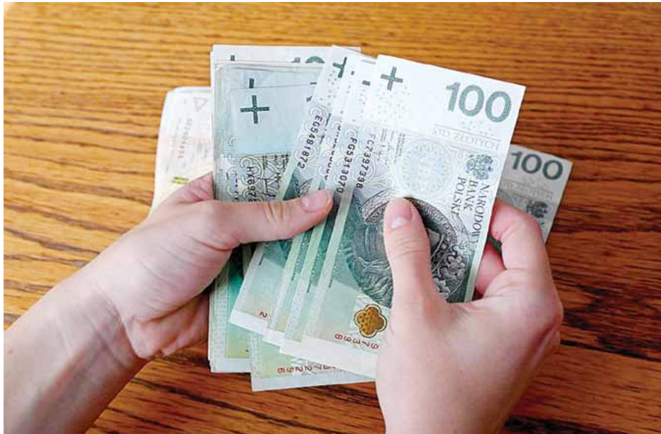
W przyszłym roku płaca minimalna wyniesie 4666 zł brutto

Wysokość najniższej krajowej wpływa też na dodatek za pracę w nocy czy wynagrodzenie za czas przestoju. Tę drugą kwestię reguluje art. 81 Kodeksu pracy, zgodnie z którym pracownikowi za czas niewykonywania pracy, jeżeli był gotów do jej wykonywania, a nastąpiły przeszkody po stronie pracodawcy, przysługuje wynagrodzenie wynikające z jego osobistego zaszerogowania, określonego stawką godzinową lub miesięczną, a jeżeli taki składnik wynagrodzenia nie został wyodrębniony przy określaniu warunków wynagradzania — 60 proc. pensji.