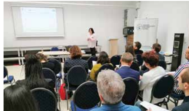
Powiatowa konferencja pn. „Ekonomia Społeczna w turystyce dla reprezentantów organizacji pozarządowych i samorządów lokalnych z terenu powiatu iławskiego”

Głównym celem COP jest wsparcie aktywności społecznej mieszkańców oraz sektora pozarządowego na terenie powiatu. Centrum Organizacji Pozarządowych w Iławie działające przy Inkubatorze Przedsiębiorczości Społecznej ma służyć mieszkańcom powiatu iławskiego – tym skupionym w organizacjach pozarządowych, tym, którzy działają w grupach nieformalnych jak również tym, którzy chcieliby się włączyć w działania społeczeństwa obywatelskiego.