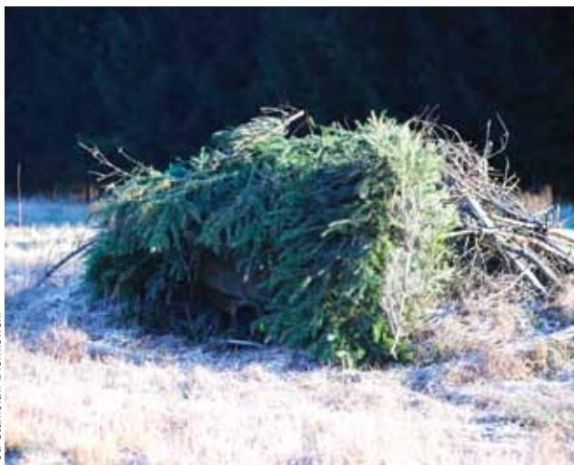
Zagłębiona w ziemi czatownia pozwala na robienie zdjęć z perspektywy żabiej