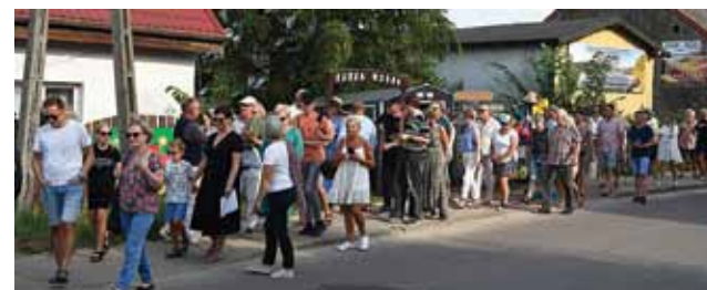
W spacerze po Siemianach udział wzięło około 70 osób