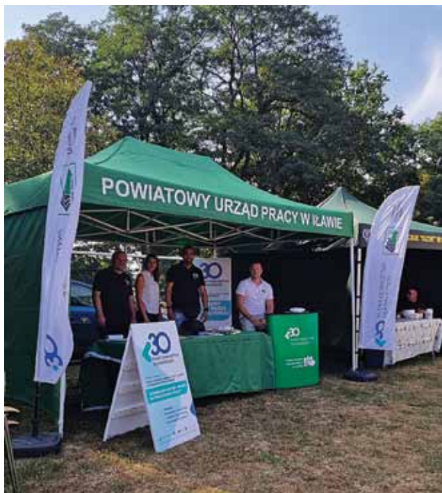
W tym roku mobilne stoisko urzędu pracy można pojawiło się w Ząbrowie, Zalewie, Ulnowie, Kisielicach i Lubawie

Działania Powiatowego Urzędu Pracy w Ławie mają na celu nie tylko zwiększenie dostępności swoich usług, ale również ułatwienie mieszkańcom powiatu ławskiego korzystania z różnorodnych form wsparcia. Aktualne informacje dotyczące kolejnych inicjatyw urzędu będą na bieżąco publikowane na oficjalnej stronie internetowej urzędu oraz w mediach społecznościowych.