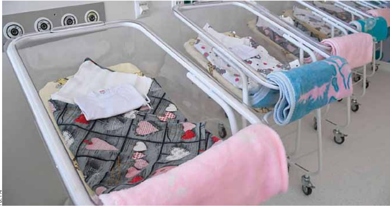
W ubiegłym roku w Polsce urodziło się tylko 272,5 tys. dzieci. To najmniej w całym okresie powojennym

Na koniec 2023 r. ludność Polski wynosiła 37,637 mln. A ubiegły rok był kolejnym, w którym spadła, bo o prawie 130 tys. w porównaniu do 2022 r. Na każde 10 tys. ludności ubyły 34 osoby. O ile jednak w 2022 r. we wszystkich województwach odnotowano zmniejszenie się liczby mieszkańców, o tyle w 2023 r.