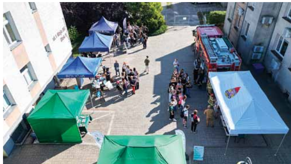
W ostatnim spotkaniu ze służbami mundurowymi udział wzięło około 300 osób