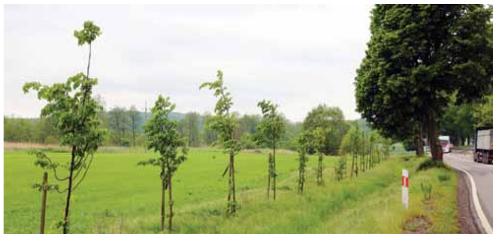
Nowe zadrzewienia wzdłuż szlaków komunikacyjnych

Rad, dostępnym w każdym kiosku i powszechnie prenumerowanym w czytelnich, bibliotekach, szkołach, a nawet zakładach pracy. Czy to niezwykłość tego czasopisma, w tamtej politycznej rzeczywistości, czy też tezy zawarte w jednym z artykułów sprawiły, że pomimo upływu ponad pół wieku, pamiętam je do dzisiaj. Autor, amerykański biolog w tekście o ochronie środowiska zawarł słynne zdanie, które jako memento jest coraz bardziej aktualne. Czy rzeczywiście z uporem godnym znacznie lepszej sprawy „...ludzkość podcina ostatnią zieloną gałąź, na której siedzi”? Czas zatarł w mojej pamięci nazwisko uczonego, który postawił tę tezę, ale stosunkowo niedawno przywołał ją papież Franciszek, na międzynarodowej konferencji o wymiaraniu gatunków i przeludnieniu, którą z jego poparciem zwołały wspólnie Papieska Akademia Nauk i Papieska Akademia Nauk Społecznych. Jeśli już sam papież, na którego patrzą oczy całego (nie tylko katolickiego) świata stwierdził, że: „Mamy czynić Ziemię zieloną, a nie sobie poddaną”, to naprawdę nie jest najlepiej. Zwłaszcza, że w mądrej księdze (Pismo Święte Starego i Nowego Testamentu – Księga Rodzaju) ta kwestia zapisana jest wyraźnie inaczej. Pochylam przed Nim z wielkim szacunkiem głowę za Jego mądrość, no i odwagę. Na konferencji, w której uczestniczyli naukowcy z całego świata stwierdzono, że jeśli nie opanujemy przeludnienia, czeka nas katastrofa! Będzie to katastrofa nie